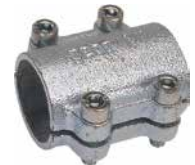
БЪРЗА ВРЪЗКА МУФА